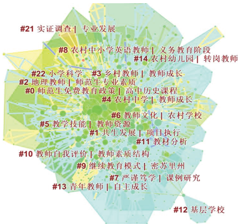
图 3 乡村教师专业发展研究关键词聚类知识图谱(2003—2018 年)

为了把握 2003—2018 年乡村教师专业发展研究领域的发展与变化,需要对相关研究的主要内容进行梳理。运用 CiteSpace 技术进行关键词的聚类分析,“找到研究领域内多年存在的热门词语” [6] ,从而有助于了解相关研究主题的演变情况。因此,本研究运用 CiteSpace 这一工具进行技术处理,并在软件设置上,选择数据抽取对象 Top50,共得到 773 个节点和 2 686 条连线,网络密度(Density)为 0.009,模块值(Modularity, Qz 值)为 0.588 2,满足大于 0.3 的条件,说明划分出来的聚类结构是明显有效的。同时需要说明的是,图 3 中的标签显示出聚类号及其标识词,聚类号以 #0、#1 依次排列(见图 3)。