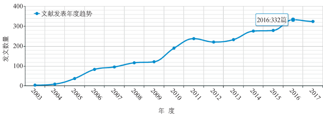
图1 乡村教师专业发展研究文献数量年度变化趋势(2003—2017年)

根据上述2 604篇有关乡村教师专业发展研究文献发表数量的年度分布情况,笔者绘制了我国乡村教师专业发展研究文献数量年度变化曲线图(见图1)。