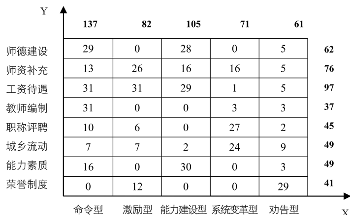
图3 地方政府《计划》执行所选用政策工具的二维分布

在提高教师政治素质和师德水平方面,命令型工具和能力建设型工具运用较多,劝告型工具次之。图3所示的统计结果表明,31个省(自治区、直辖市)中,有81%的省份选择了命令型工具和能力建设型工具二者结合,10%的省份选择了命令型工具和劝告型工具二者结合。典型的省份,如四川省综合运用了多种政策工具,既采用了命令型工具规定师德表现作为年度考核、职务晋升等的重要参考,并实行“一票否决”,又运用了劝告型工具,强调师德宣传,激励引导乡村教师扬师德强师表,还运用能力建设型工具,把师德教育纳入乡村教师入职后的培训内容。在师德建设方面的不足之处在于,只有7个省份结合本省实际提出了更为明确的师德建设路径,其他省份只是沿用国家政策文本的宏观表述,缺乏对师德考评机制、监督机制、责任机制、培训机制、宣传机制等相关机制的详细表述。