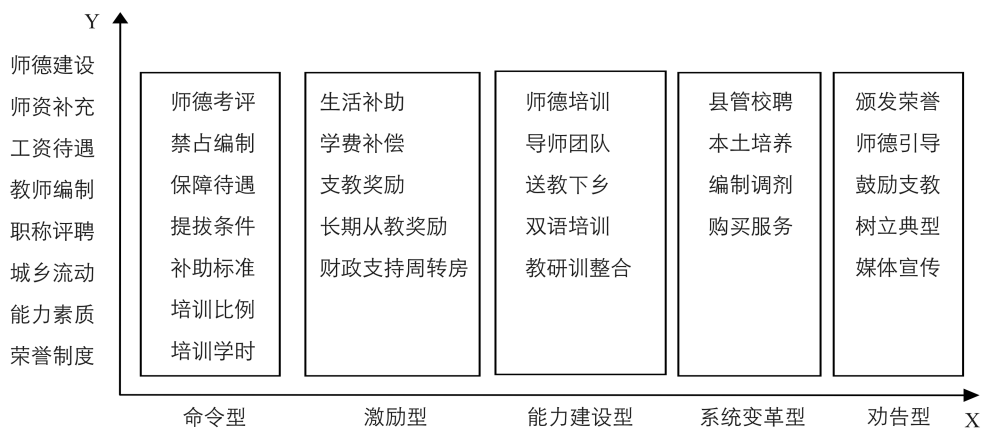
图 1 乡村教师支持政策执行二维框架