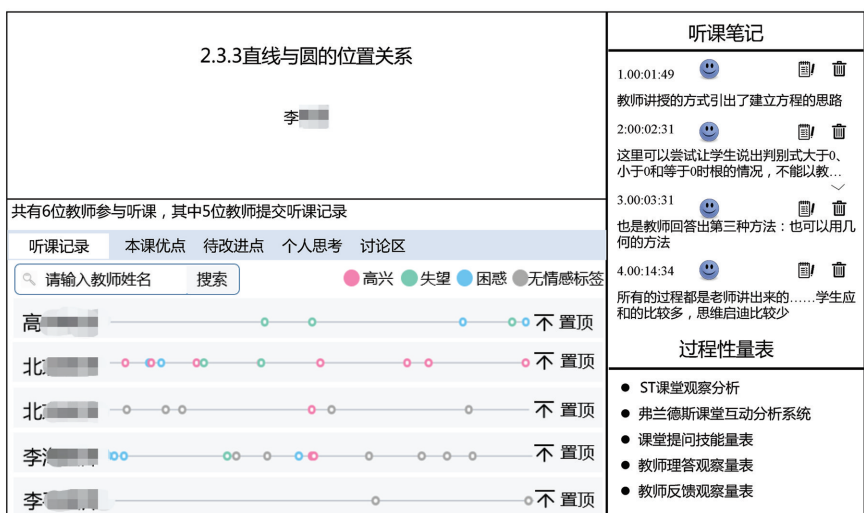
图3 智能教研平台“诊课”界面

教研组运用智能平台已有分析量表,依据听课教师记录的“打点”数据,可以分析课堂上的教师行为占有率、师生行为转换率、教师的问题类型、教师挑选学生回答方式、学生回答方式、学生回答类型、教师回应方式、教师回应态度、师生对话深度和课堂问题结构等课堂教学行为。在对每节课进行深入分析后,智能教研平台形成报告并给出改进建议(如图4所示)。通过智能化平台的支持,教研组可以结合数据深入研究每节课,对教师的课堂行为进