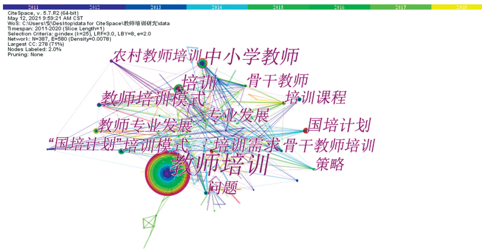
图2 我国教师培训研究关键词共现图谱

师培训存在的问题及其原因,并进一步提出了解决对策与优化路径。从研究对象看,城市教师与农村教师的差异性尚未得到关注和重视;从研究内容看,对教师培训问题的诊断成为了教师培训研究中最主要的研究内容;从研究类型看,经验总结与概念思辨是该阶段较为主流的研究方式,鲜有实证性质的相关研究。