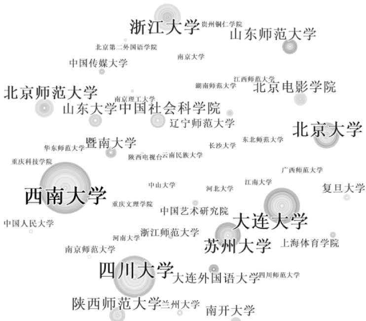
图1 中国侠文化研究机构聚合图

在研究成果的形成中,相关学术机构将具有同一研究旨趣和相关学术背景的学者聚合起来,或独立或协同进行研究,可以有效地实现研究力量的整体效应。改革开放40年来,总计有287个机构的学者发表了中国侠文化研究论文。主要研究机构的聚合情况见图1,发表10篇以上文章的研究机构见表2。机构统计有以下几点需要说明:(1)改革开放40年来,不少机构经历了分合及更名等变化,本文按其现有机构名称进行统计,不再统计历史机构名称;(2)人员流动及兼职所带