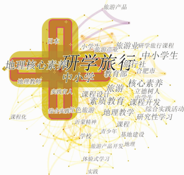
图3 关键词共现网络图谱

研学旅行育人价值通过学习积累而实现。在研学旅行情境中,学习如何发生?已有研究主要分为3个视角:经验学习理论、情境学习理论和建构学习理论。依据经验学习理论,研学旅行过程中学习受到认知因素、情感因素及行为因素的刺激,通过资源、知识和个体的交互,研学旅行者抓住经验、转化经验,从而实现学习的经验、反思、分析和评估等环节,反思是研学旅行者的核心行为 [7] 。依据情境学习理论,研学旅行是离开惯常的社会网络,进入一个新的临时的社会组织,唤起好奇心,引发新的学习兴趣,其本质在于新环境触发的学习兴趣和可供学习的社会组织 [8] 。依据建构学习理论,研学旅行是在原有认知结构上对新