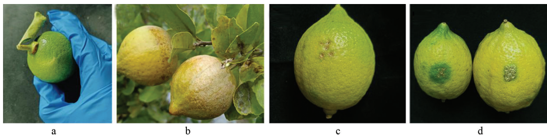
a~b: 田间症状; c~d: 接种 NM005 的果实发病症状

接种病原菌的果实在接种 7 d 后呈现出染病症状, 果实接种部位初期出现白色半透明的光滑病斑, 而后病斑扩大, 颜色变成灰白色, 质地逐渐粗糙, 呈现与田间相似的发病症状(图 1c~1d)。